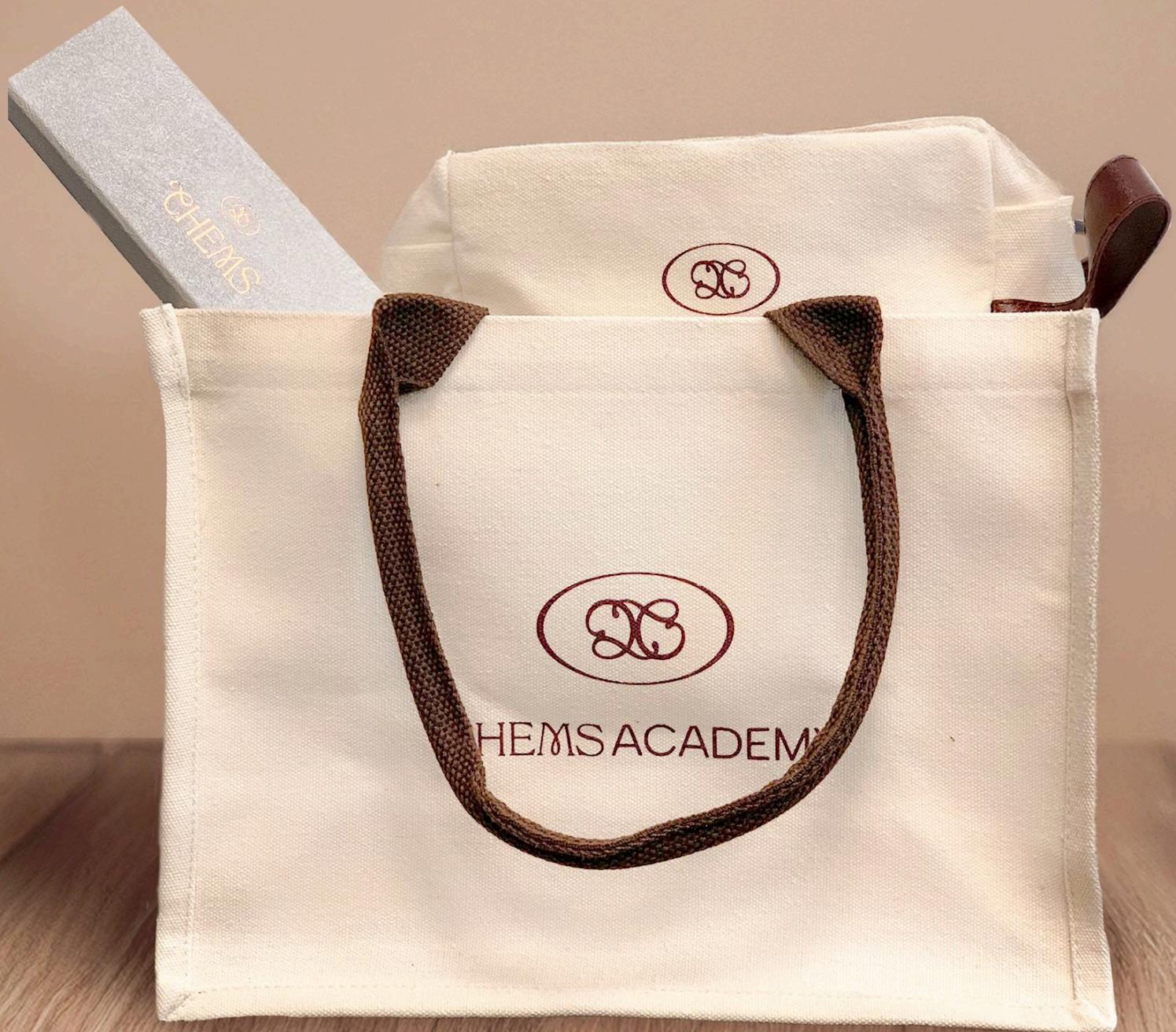
Machine non incluse dans le kit

KIT INCLUS Remis lors de votre formation